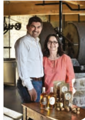
Le Moulin de la Vie contée Anne Jaubertie - Ligneyrac

Ynovéa, c'est un gage de qualité et ça veut aussi dire qu'on appartient à un territoire, à un groupe de personnes qui veulent avancer, promouvoir tout ce qui se passe sur ce territoire et mettre en avant tout le travail effectué ici.