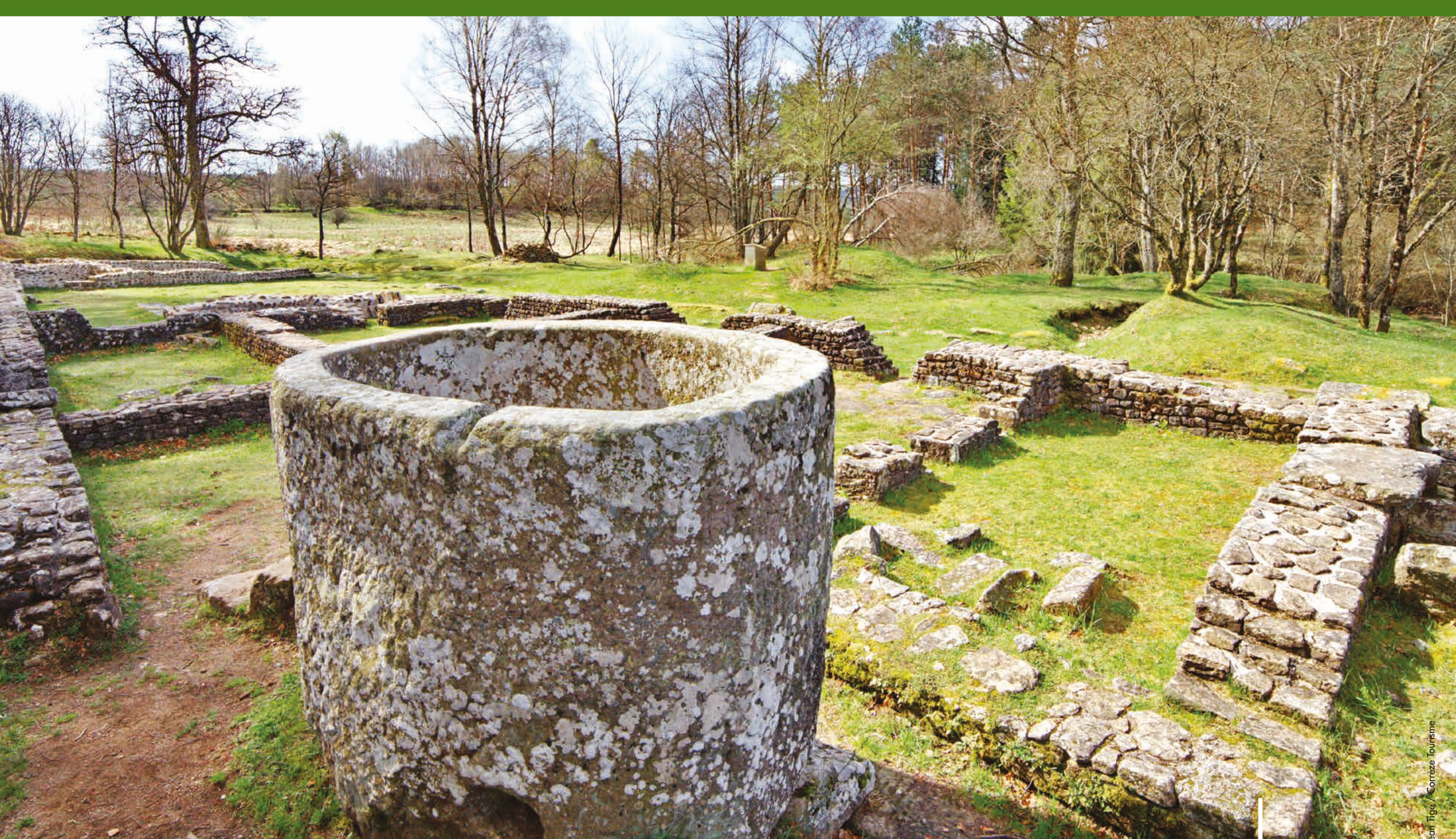
Vestiges des Cars