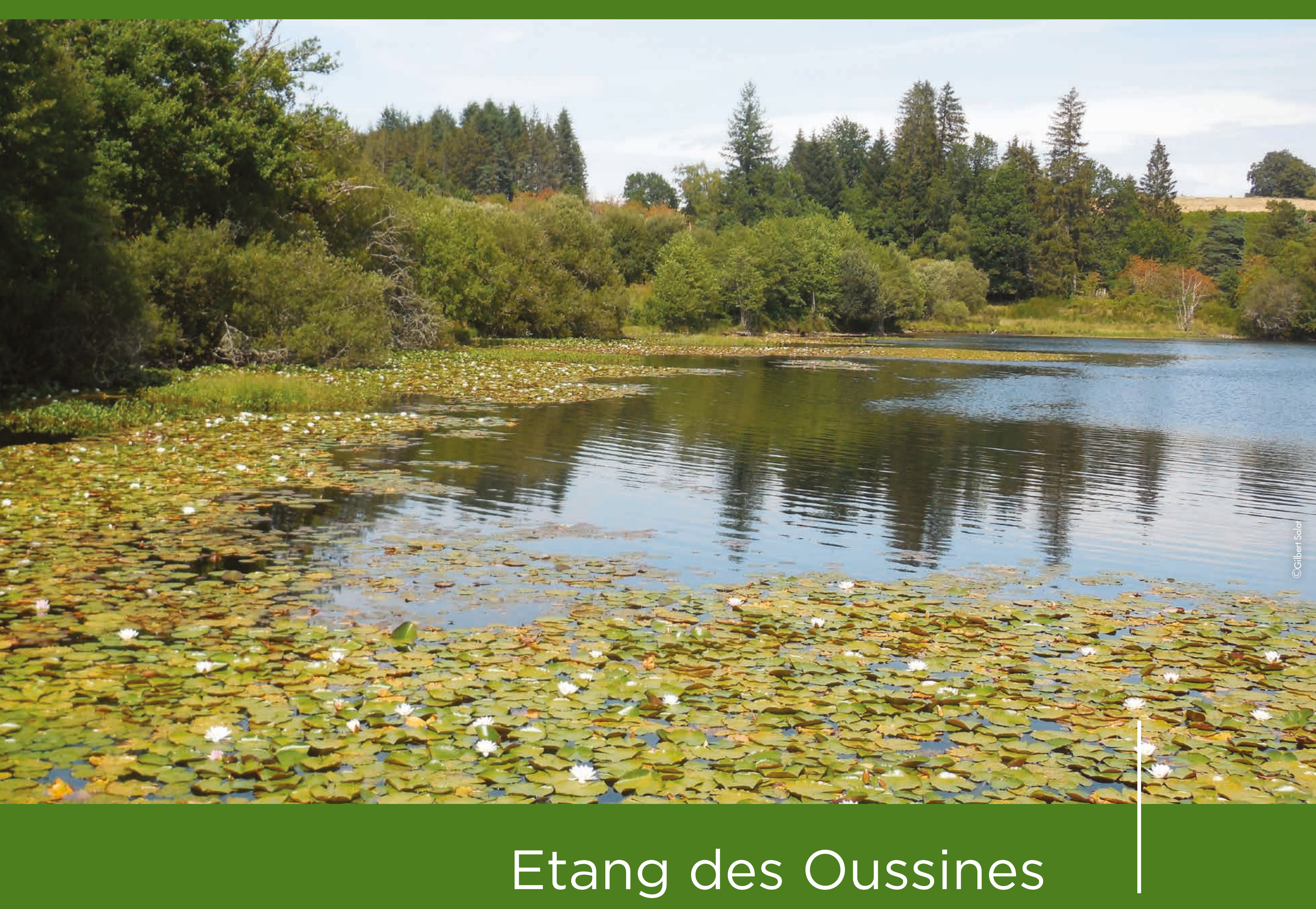
Etang des Oussines