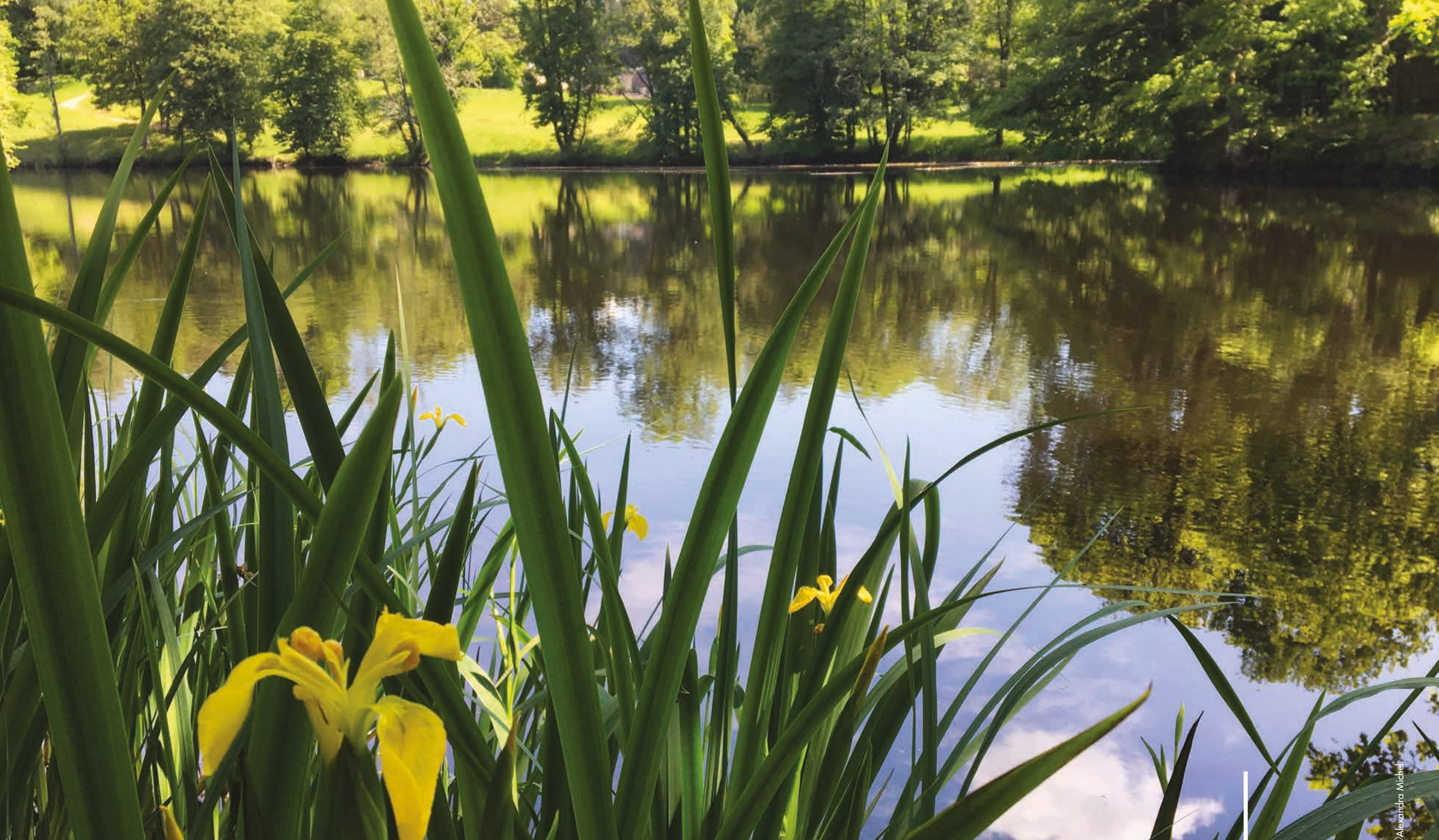
Étang de Sédieres